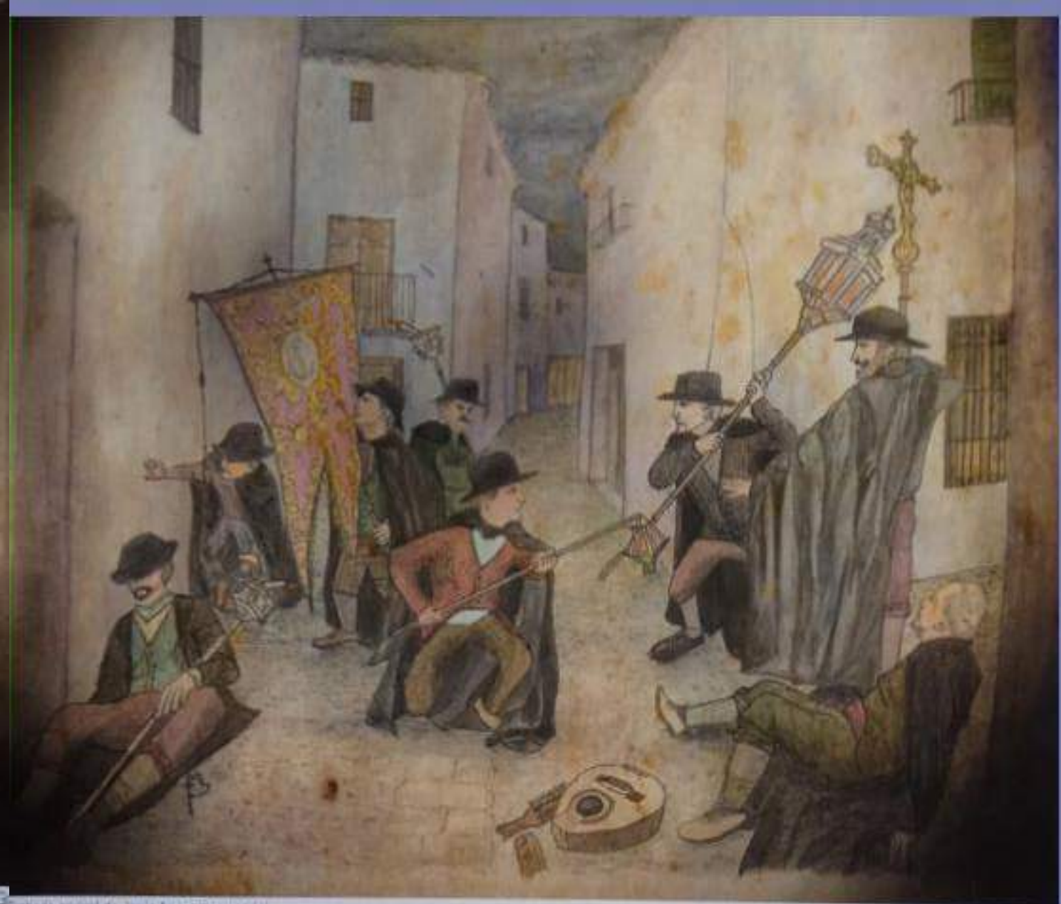
Grabado original de Jesús Arroyo (recreación)